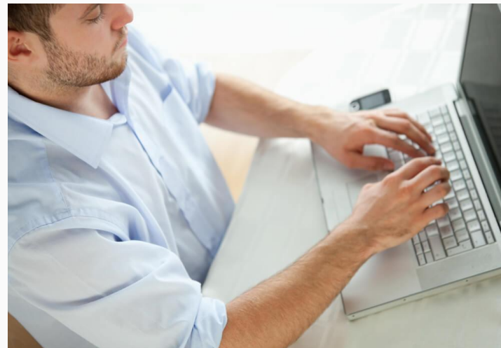
TABELA DE COMISSIONAMENTO

Após o cadastramento você estará apto a vender o Cartão Vida Melhor. Acesse sua conta ( MINHA CONTA ) e siga as orientações abaixo: